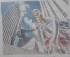
Koons' arhen seinem Kunstwerk

des Rheins seien alle Regionen betroffen gewesen, teilte der Deutsche Wetterdienst (DWD) in Offenbach mit. Zwischen Schleswig-Holstein und Braunschweig gingen Fliegerkörner mit einem Durchmesser von bis zu zwei Zentimetern sowie Regen von bis zu 20 Liter pro Stunde und Quadratmeter nieder. In Nordhessen kanten innerhalb von zwei Stunden sogar 30 Liter Regen pro Quadratmeter herunter. Am Sonntag besteht vor allem im Südosten des Landes Gewitterrisiko.